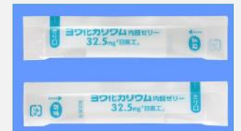
【ヨウ化カリウム内服ゼリー】