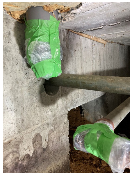
脱落箇所 B 養生後 (2022年8月8日実施)