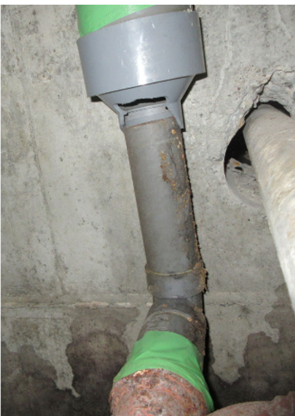
脱落箇所 B 仮養生後 (2022年8月4日実施)