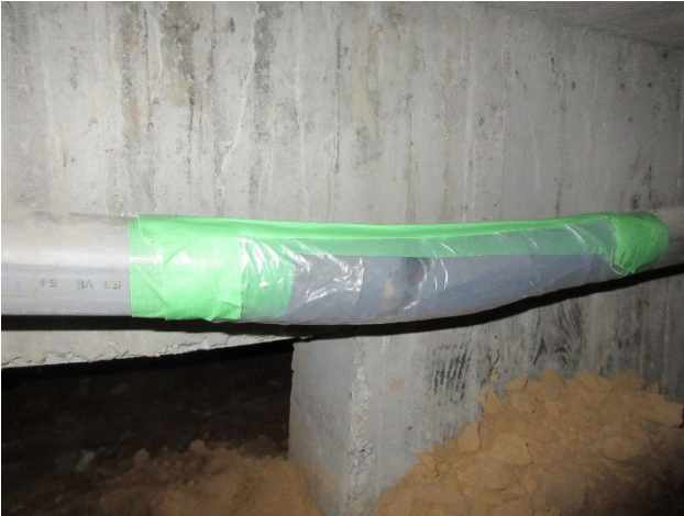
破断箇所 A 養生後 (2022年8月4日実施)