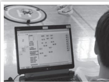
▲ドローンの最新技術を体験しよう！