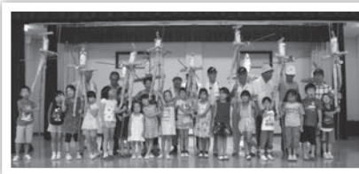
▲謎のわら人形「大助人形」を作ろう！