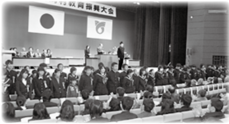
スポーツや芸術・文化分野で活躍し、表彰を受けた児童・生徒たち