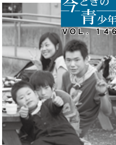
※写真右端が今回のエッセイスト