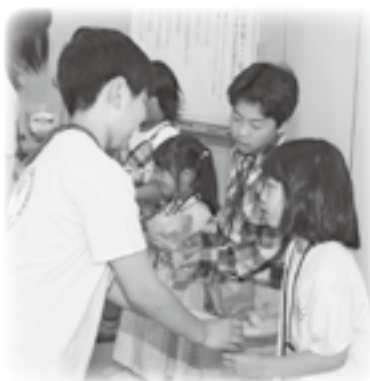
歓迎の花束が手渡されました。

6月8日、舟石川コミュニティセンターで東海村少年少女合唱団の平成25年度「入団式」が行われました。結成30周年を記念した組曲「ふるさと東海村」を3月に発表するなど、東海村の魅力が村内外に発信し続けているこの合唱団——。今年度は新たに6人が入団し、昨年度の途中に入団した2人を含む8人による入団式となりました。新入団員は1人ずつ名前を呼ばれて元気に自己紹介をした後、先輩団員から花束を手渡されました。その後に行われた歓迎演奏では、おそろいのTシャツを着た先輩団員たちが、ダンスを交えながらレポーターを披露すると、初めは緊張気味だった新入団員たちにも歌うことの楽しさや喜びが伝わったのか、明るい笑顔を見せてくれました。