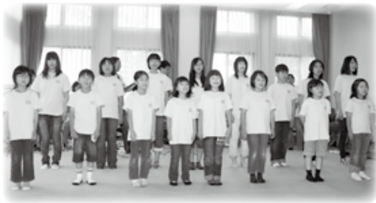
新しい仲間を美しい歌声で迎える先輩団員たち