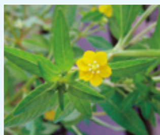
ウスゲチヨウジタデ

ウスゲチヨウジタデはアカバナ科の1年生植物で、湿地・水田・休耕田などに生え、本州(関東以西)、九州、沖縄に分布しています。名前の「丁字」は、花の後に残る子房が丁字形なことに、蓼は、葉がタデ科のタデに似ていることにより、茎は高さ50〜80センチメートルで、8〜10月に葉の脇に黄色の5〜6枚の花弁を持つ花を付けます。