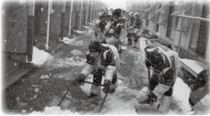
会津若松市内の仮設住宅では、吹雪の中で雪かき作業を行いました。