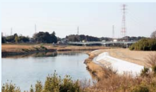
▲久慈川沿岸から見た櫓橋

出よ 水清きゴジンヤ橋の思い うな和歌を作っています。 城里町石塚出身)は次のよ