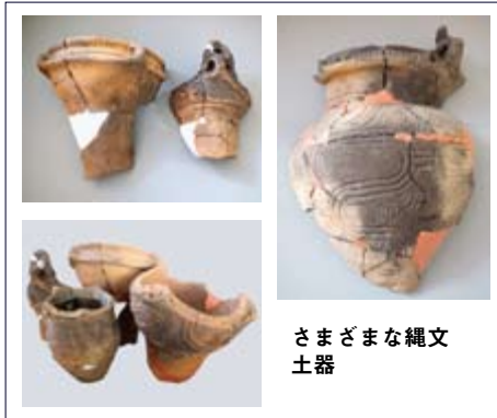
さまざまな縄文土器

■問い合わせ 生涯学習課文化・スポーツ振興担当(☎282-1711 内線1423)