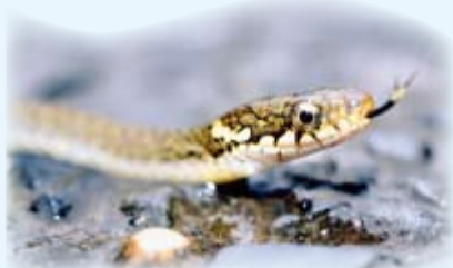
新参へび・ヒバカリの肖像

太古、爬虫類が地上を占有した時代に森林の中に出現した哺乳類が、恐竜などの目を避け、おびえた暮らしを続けた悪夢こそ、ヒトやサル類のへび嫌いの原点という仮説を納得。村のへび類は、餌となるカエルや昆虫類の減少で生息数は減ったかに見えますが、その一方、へび類を捕食するワシ・タカ類ばかりか、カラス・サギ類も幼蛇を食い、受難の極にあります。それでも、大型のアオダイショウ、おとなしいシマヘビ、水辺でカエルを狙うヤマカガシ、年に数回会えたならうれいジムグリ、ため池の岸や新川沿岸の草原で出会う毒へび・マムシと5種類が荒れ地の広場や湧き水が潤す原野の