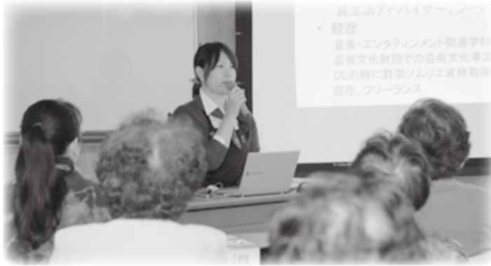
旬の食材を使った料理を紹介しました。