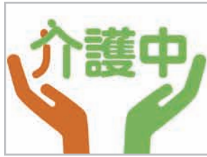
▲静岡県考案の「介護マーク」

認知症などの方への介護は、介護をしていることが分かりにくいいため、誤解や偏見を持たれることがあります。この「介護マーク」は、介護中であることを周囲に理解してもらうために静岡県で考案されたもので、現在、県内でも普及を図っています。