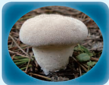
平成16年11月6日・村松地内

さて、東海村のマツ林を特徴づけるキノコの一つに、ヒタチノスナジホコリタケがあります。このキノコは、ヨーロッパと北アメリカに分布することが知られていますが、日本からは報告がありませんでした。ところが、最近になって東海村、ひたちなか市や稲敷市など、茨城県内