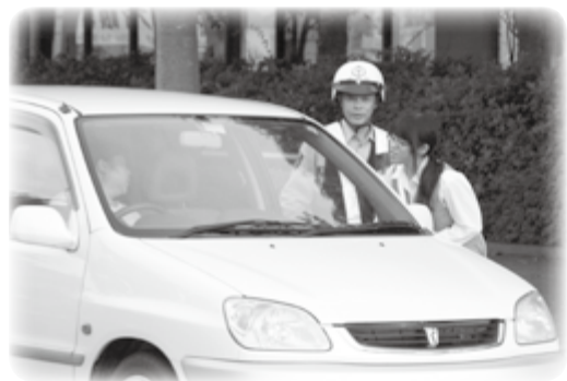
県立東海高等学校の生徒会のメンバー7人も街頭キャンペーンに参加し、反射材の着用等と呼び掛けました。