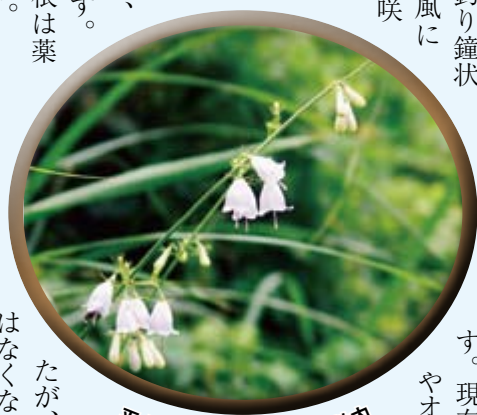
平成18年8月26日・須和間地内

ツリガネニンジンの主な生育地は明るい緑林や水田脇の土手などの草地です。茎の高さは40〜100センチメートルで、切ると乳液が出ます。葉の付き方は普通3〜5枚が輪生します。花も輪生して数段に数個ずつ釣り鐘状の小さい花を下向きに付け、風に揺られ今にも鳴り出しそうに咲いています。花冠の先はキキョウのようなように5裂してやや広がり、めしべは花冠よりやや突き出します。名前の由来は花の形が釣り鐘、根茎が朝鮮ニンジンに似ているからです。花の咲く様子からフウリンバナ、チョウチンバナとも呼ばれます。若苗はトドキと呼ばれ食用、根は薬草になることが知られています。