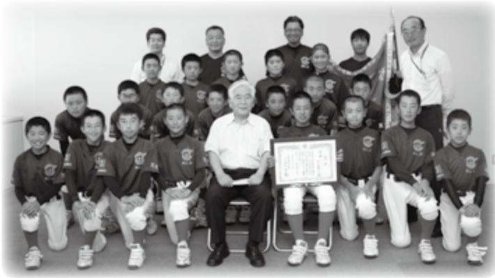
茨城県大会で優勝し、全国大会に出場するオール東海ジュニア(東海村スポーツ少年団)のメンバー