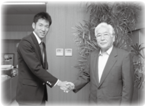
サモア出発前の6月22日、村長を表敬訪問しました。