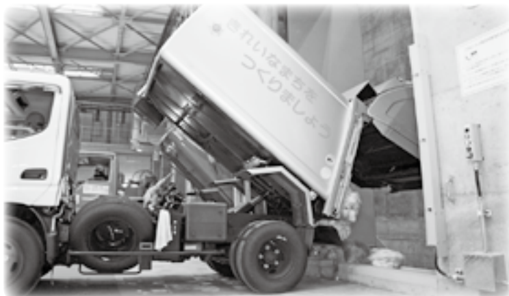
東海村(写真手前)とひたちなか市のごみ収集車から可燃ごみが搬入されました。