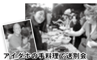
アイダホの手料理で送別会