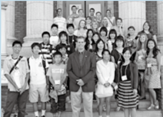
アイダホフォールズ市の学生と共に市庁舎前で記念撮影。写真中央はジャレッド・ファーマン市長。

東海村は、1981年にアメリカ合衆国アイダホ州アイダホフォールズ市と国際親善姉妹都市の盟約を締結し、現在までに延べ約850人が相互に親善訪問や学生のホームステイを実施するなど、30年にわたり交流を深めてきました。