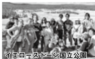
イエローストーン国立公園