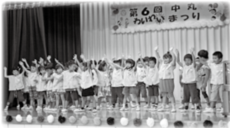
須和間幼稚園年長児が歌や遊戯を発表し、“わいわい”にぎやかな会場に…