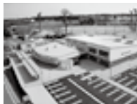
内原図書館(水戸市)

※東日本大震災の影響により、一部の施設で利用が制限されている場合があります。利用の際は事前に各施設にお問い合わせください。