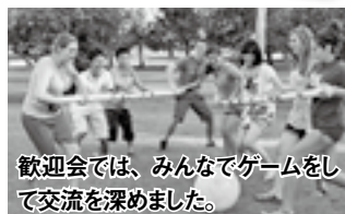
歓迎会では、みんなでゲームをして交流を深めました。