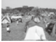
酒沼自然公園(茨城町)