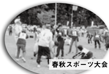
春秋スポーツ大会

高齢化が進む中で、心身の健康保持と楽しく生き生きとした生活を続けていくため、楽しむことを目的としたサークル活動や、明るい地域社会づくりに貢献するためのボランティア活動、仲間同士で支え合う生きがいづくり支援活動など、高齢者クラブではさまざまな活動に積極的に取り組んでいます。