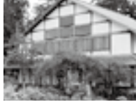
やすらぎの里小川(小美玉市)