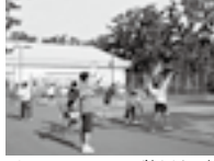
ビーチテニスクラブ(大洗町)