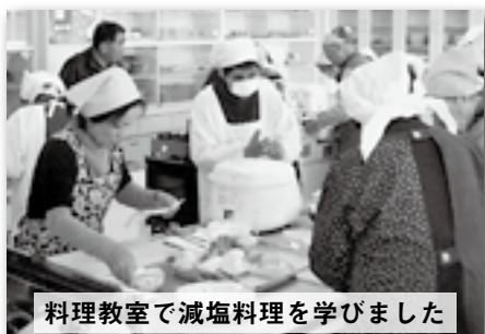
料理教室で減塩料理を学びました