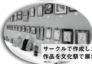
サークルで作成した作品を文化祭で展示