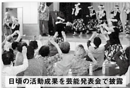
日頃の活動成果を芸能発表会で披露