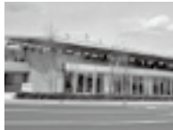
笠間図書館(笠間市)