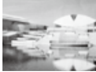
那珂総合公園(那珂市)