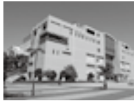
総合運動公園(ひたちなか市)