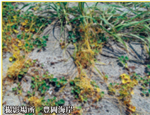
撮影場所 豊岡海岸

環境省では、生態系に影響を及ぼす恐れのある動植物を含む外来種148種についての「要注意外来生物リスト」を作成しています。アメリカ