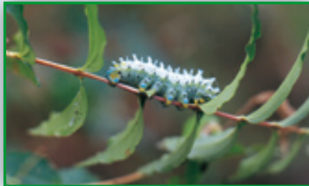
シンジュサンの幼虫

林床に、丈2メートルにはならない低木の株が散在。枝先は緩やかに垂れ、葉は濃緑。褐色の枝に淡い紅色の丸い実の集まりを見つけました。もうしばらくすると真赤な実となり、食べる毒だぞと警告する毒樹、ドクウツギだとすぐ分かります。葉先が何ものかに食われて傷んでいます。隣の枝に野蚕と呼ばれるヤマユガの仲間、シンジュサンの幼虫がいました。体長は6センチメートル、太さは親指ほどで、体色は青緑がかった白い肌には黒い斑紋を散らし、全体としては老熟した蚕に似ています。頭を上げ、腹部を伸縮させて歩き、小さいながら鋭い口器で葉片を食べ続けています。