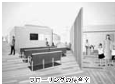
フローリングの待合室

小児科医師の増員のほか、各科目の診察室とは別に、正面玄関すぐ右側に小児専用の診察ゾーンを設けます。待合室や診察室は一般外来と分け、授乳コーナーや小児用多目的トイレも設けます。また、待合室には床暖房を採用し、小さな子どもへの配慮をしています。なお、床暖房は、機能回復訓練室(リハビリテーションゾーン)にも採用しています。