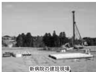
新病院の建設現場

敷地面積は、約1万8000平方メートル。建物は、地上3階建て、延べ床面積は、約7000平方メートル。外来用約160台、職員用約90台が収容可能な駐車場を備えます。1階が外来、2階が療養病棟、3階が一般病棟となります。1階の中央や2、3階の病棟中央に光庭を設け、自然光を多く取り入れる構造としています。