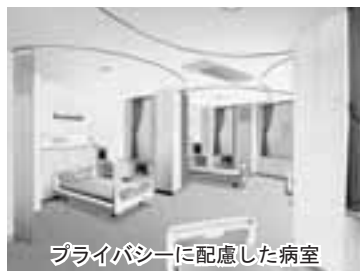
プライバシーに配慮した病室

個室以外の病室は、4床室となります。家族がゆつたり面会できるベッド間隔を取り、ベッドごとに窓（マイ・ウインドー）を配置します。ベッドは正対せず、斜めに配置することで、患者同士の視線が直接合うことを避け、プライバ