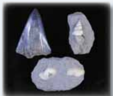
岩盤(村松層)から出た化石例

去る3月、「学校の裏のがけから、児童が貝化石らしいものを採りました」と、村松小学校の校長先生から電話をいただきました。