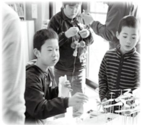
紙トンボに興味津々です

3月13日、「真崎地区ワクワクFOODフェスティバル2010」が真崎コミュニティセンターで開催されました。これは“食”を通じて交流を深めようと真崎地区委員会が主催したものです。地元・村松小学校の児童による吹奏楽や太鼓の演奏が会場を盛り上げる中、来場者は、地域の人たちが用意した水餃子やチョコレートフォンデュ、味噌こんにゃく、ポップコーンなどを食べながら話に花を咲かせていました。また、紙トンボやベーゴマコーナーには子どもたちが集まり興味津々。“遊びの先輩”であるスタッフからコツを教わる姿も見られました。おいしいものを食べながら、世代を超えて地域の絆を深める——そんな祭りとなりました。