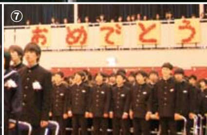
①⑥⑦は東海南中学校、②③④⑤は東海中学校の卒業式の様子