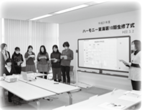
福祉や教育等、分野ごとに東海村の良いところを発表する第10期生

3月2日、ハーモニー東海第10期生・16人の修了式が役場会議室で行われました。第10期生たちは、「ごみのゆくえ」や「救急車が来るまでにできること」、「住民自治の在り方」など、村の制度や施設、生活する上で必要な知識を学んできたことをスライドで振り返りました。続いて、具体的に設定したある家族に対して東海村の良いところを教えると想定した発表では、「保育所に入るまで一時保育が受けられる」「東海村吹奏楽団に入ることができる」「家庭菜園の畑を借りることができる」など約50項目を挙げ、「東海村」を1年間学んできた総まとめを行いました。「回を重ねるごとに徐々に村政に興味を持つようになりました」——修了生からの感想です。