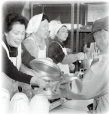
餃子教室で餃子作りに挑戦 “グルメすいとん”はいかがですか？