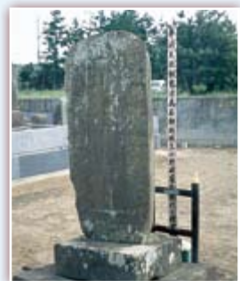
長松院の石神小野崎氏墓碑

に兵を集め始めます。維茂が三千の兵を集めたのに対して、諸任は千人しか集められませんでした。これでは勝負になりません。諸任は常陸の所領に引き揚げてしまいます(このことから、秀郷流藤原氏が、すでに諸任の時代、常陸に基盤を持っていたことがうかがえるのです)。戦闘は回避されたかに思われましたが、これは諸任の策略でした。油断した維茂軍に諸任が夜襲を仕掛けたのです。諸任軍の大勝利でした。命からがら逃げ延びた維茂でしたが、ここから彼の反撃が始まります。「大君」と呼ばれる武者から引き揚げる途中の諸任軍が祝勝の酒盛りをして、この情報を得て、これをわずかな手勢で急襲したのでした。こんなに早く維茂が反撃してくると思ってもみなかった諸任軍は手も足も出ません。ここに争いは決着しました。