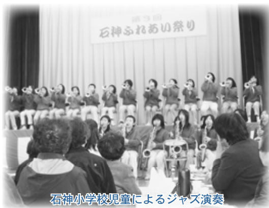
石神小学校児童によるジャズ演奏