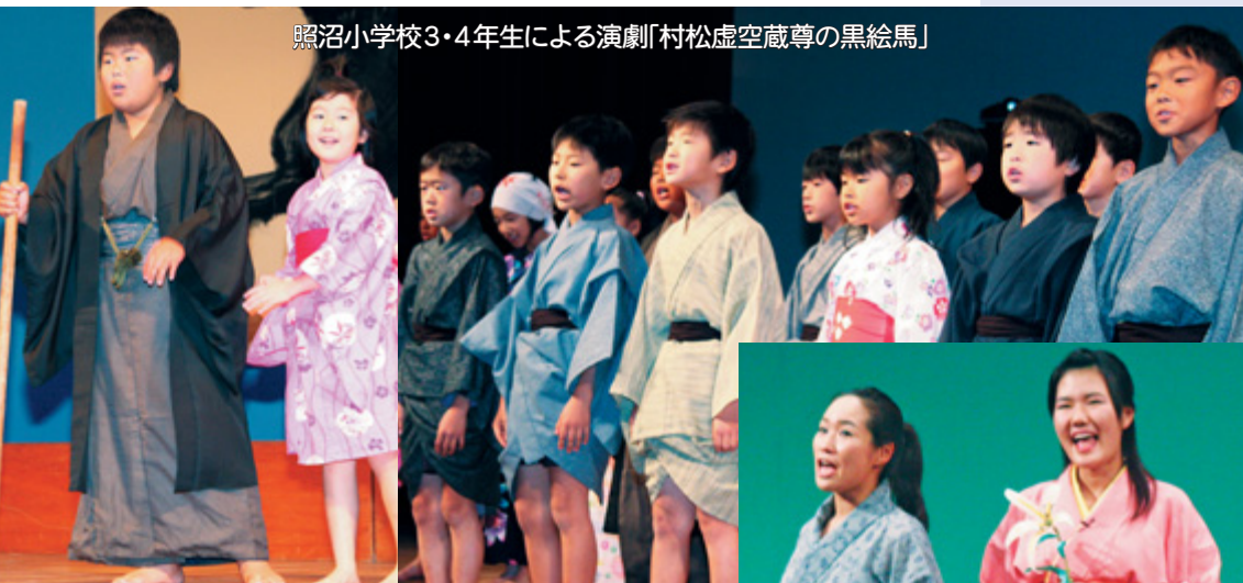
照沼小学校3・4年生による演劇「村松虚空蔵尊の黒絵馬」