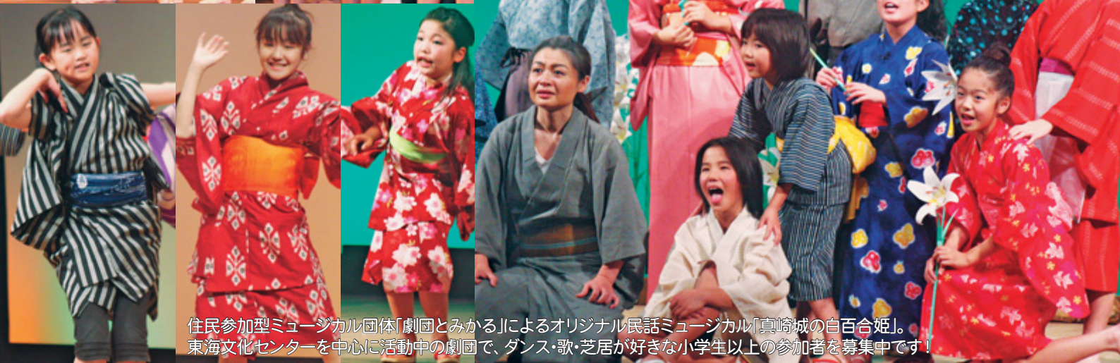
住民参加型ミュージカル団体「劇団とみかる」によるオリジナル民話ミュージカル「真崎城の白百合姫」。 東海文化センターを中心に活動中の劇団で、ダンス・歌・芝居が好きな小学生以上の参加者を募集中です！