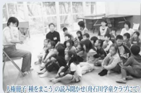
人権冊子「種をまこう」の読み聞かせ(舟石川学童クラブにて)

本村では、人権週間にちなんで「特設人権相談所」を開設します。この相談は毎日の暮らしの中で起こるさまざまな人間関係に関する問題を解決に導くための相談です。差別問題・家庭内問題・近所のもめ事など、身の回りでお悩みのことはありませんか。相談は無料で、秘密は厳守されますので、どうぞお越しください。