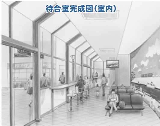
待合室完成図(室内)