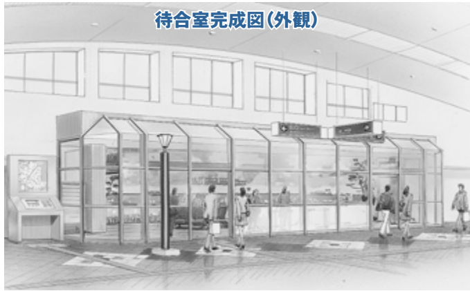
待合室完成図(外観)