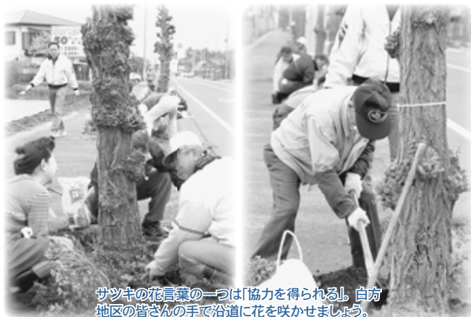
サツキの花言葉の一つは「協力を得られる」。白方地区の皆さんの手で沿道に花を咲かせましょう。