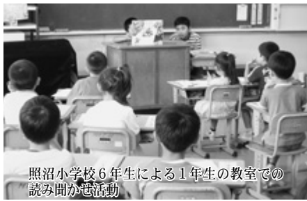
照沼小学校6年生による1年生の教室での読み聞かせ活動

文部科学省等主催の「平成20年度子ども読書の日記念子ども読書活動推進フォーラム」で、村立照沼小学校（戸祭久則校長、生徒数121人）が渡海紀三朗・文部科学大臣より「平成20年度読書活動優秀実践校表彰」を受け、全国136校の被表彰校を代表して、日ごろの活動報告を行いました。