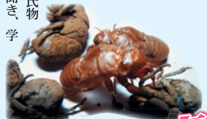
アブラゼミの幼虫の抜け殻 (写真中央)と、泥で汚れた ニイニゼミの幼虫の抜け殻