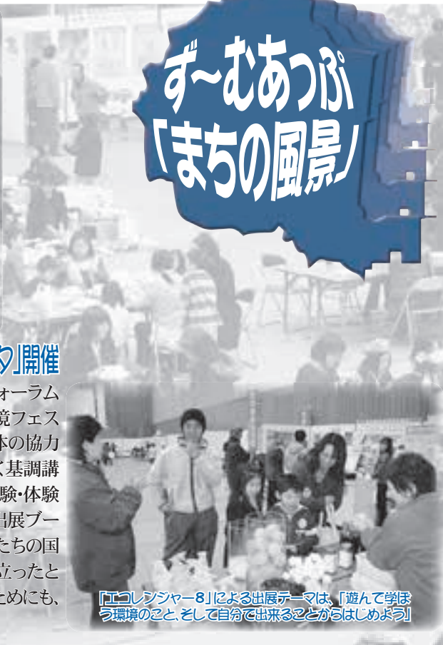
「エコレンジャー8」による出展テーマは、「遊んで学ぼう環境のこと、そして自分で出来ることからはじめてみよう」