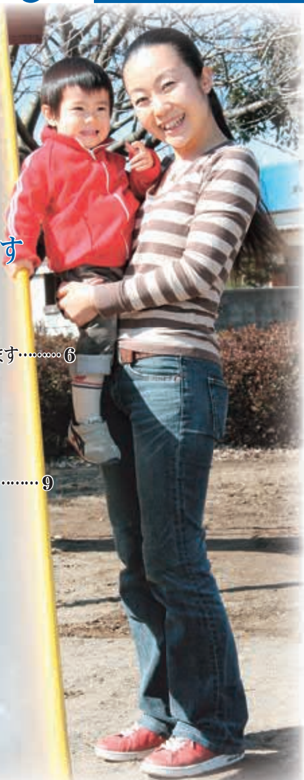
撮影地/駅西第2児童公園(舟石川駅西)