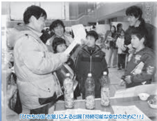
「ひたちの国・志塾」による出展「持続可能な幸せのために!!!」