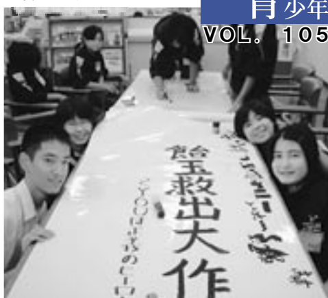
一番左が今回のエッセイスト