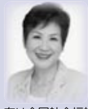
広瀬久美子 (ひろせ・くみこ)

フリーアナウンサー／元NHKアナウンサーとして「週刊ボランティア」「きょうの料理」をはじめ多くの番組を担当。平成12年8月にNHKを退社後フリーアナウンサーとなり、現在は全国社会福祉協議会の運営委員をはじめ、さまざまな分野で活躍中！