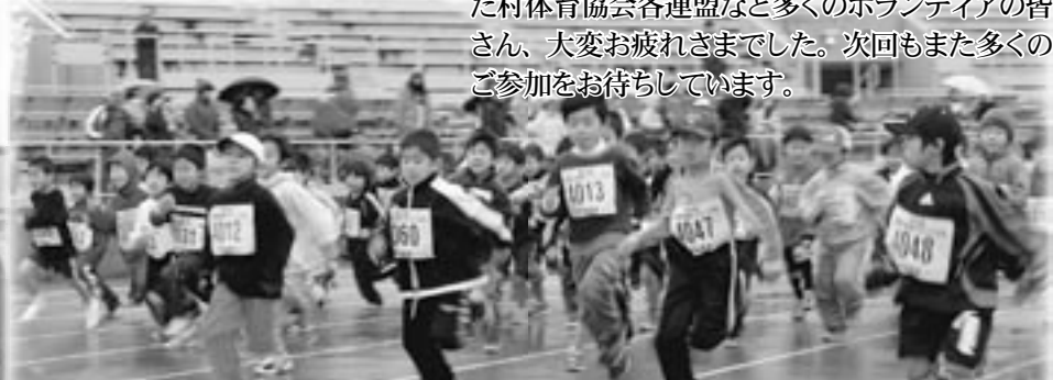
「小学1年生男子1km」の部