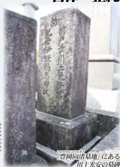
「豊岡向瀆墓地」にある川上光安の墓碑

それらは今でも「国立公文書館」(東京都千代田区北の丸公園3番2号)で保存され、地元でも時折関係者のご子孫宅には、下書きとしての当時の記録類が残されています。維新の混乱期に活躍した志士たちの貴重な記録でもあります。