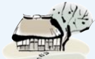
ふるさと歴訪 歴史を再発見

そんな彼女には、人と社会の役に立っていきたく いという志も――。「東海村青年会」や「茨城県ユー スホステル協会」ではイベントの企画・運営、和太鼓 の会「遊楽疾風」では県内の祭り・福祉施設でお囃子 を披露するなど、地域貢献活動を通して多くの仲 間をつくり、人とのつながりを大切にしてきたほか、 村の「自治基本条例策定委員会」や「一般廃棄物処理 施設運営協議会」の委員も務めています。これから の地域社会でのますますの活躍を楽しみます。