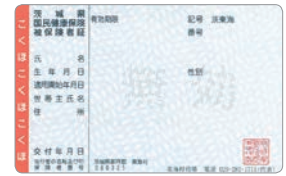
国民健康保険被保険者証(見本)

7月12日(金)から、令和元年度の「国民健康保険被保険者証(70歳以上の方は「国民健康保険被保険者証兼高齢受給者証」)」を、世帯主の方宛てに簡易書留で郵送します。新しい保険証は、住所・氏名などの記載内容を確認の上、8月1日(木)からご使用ください。古い保険証は、8月1日(木)以降に廃棄するか、住民課へ返却してください。