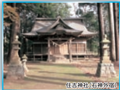
住吉神社(石神外宿)

東海村には須和間と石神外宿に住吉神社があります。この神社は一般に、港や入江などに祀られています。須和間は『新編常陸国誌』や『水府志料』によると元は「諏訪間」「洲浜」と書き、上諏訪、下諏訪明神の二社の中間に住吉明神があったので「諏訪間」と付けたとみえます。おそらく「諏訪間」は「洲浜」が転じたものでしょう。縁起には、和銅元(708)年、左大臣橘諸兄が創建したとあります。永正3(1506)年に社殿炎上、寛文中(1661-73)徳川光圀が社殿を修理し、神鏡・大刀を奉獻したとみえます。ただし、橘諸兄が左大臣となったのは天平15(743)年です。