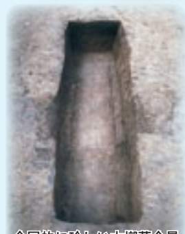
全国的に珍しい木槨墓全景

村松村と石神村が合併して誕生した東海村が50周年を迎えた2005年は、多くの記念行事が行われました。その一つに、真崎古墳群を史跡公園として整備しようとする基本調査が実施されました。私たち茨城大学考古学研究室は、調査協力の要請に応えるため、万全の準備をして発掘調査に臨みました。