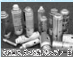
穴を開け、ガスを抜いたスプレー缶

4月14日、清掃センター不燃物処理施設内で、回収されたスプレー缶のガスが原因とみられる爆発事故が発生しました。幸いけが人は出ませんでした。施設の補修のため、一時的にごみ処理を中断することとなり、住民の皆さんに大変なご迷惑をお掛けしました。ガスの入っているスプレー缶をそのまま処理すると、引火による爆発事故が発生する可能性があるため、大変危険です。スプレー缶をごみに出す際は、必ず穴を開け、ガスを抜いてから出すようにしてください。