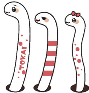
1 千 号 ア ／ ナ 2 号 ゴ ／ 3 号 応 援 隊