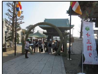
※前年度の実施状況