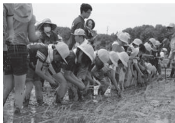
ふれあい圃場での稲作体験