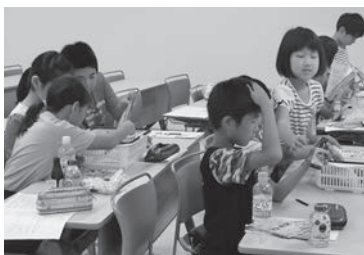
廃棄物処理施設の見学