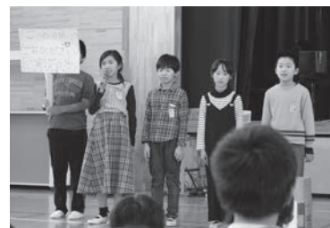
収穫祭で昼食時のごみの分別を呼び掛け