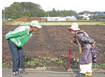
▲声掛け訓練の様子①

この訓練は「この人、認知症かも…」と気になる人を想定して、見守り・声掛けができるようにするためのもので、当日は、2つのルートで認知症役・声掛け役・随行者役に分かれて行いました。訓練後は意見交換会を実施し、それぞれの立場から気付いたことや感想などを伝え合いました。訓練を通して、実際に認知症の人や地域で気になる人に出会ったときの、安心できる声掛けや関わり方について学ぶことができました。