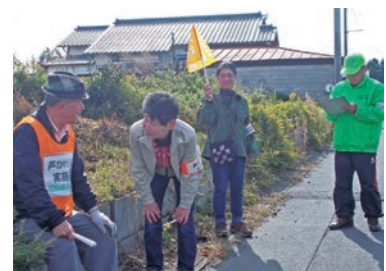
▲声掛け訓練の様子②