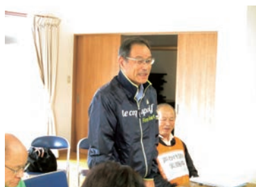
▲自治会長あいさつ