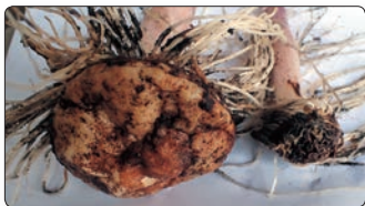
雌株(左側)と雄株(右側)の地下茎