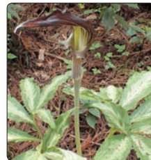
ミミガタテンナンショウ

生育地がありますが、林内の環境が変化して、減少傾向にあります。今年3月に発行された『東海村の自然誌II』(東海村教育委員会)では、準絶滅危惧種(東海村レッドリスト)に指定されています。 仏炎苞の中には付属体と呼ばれる長い棒状のものがあります。花は付属体の基部にあり、外側からは見えません。内部を観察してみると長い花序があり、雄しべ(雄株)あるいは雌しべ(雌株)が多数集まっています。同じ株でイモ状の地下茎が小さい時には雄株、大きくなると雌株に変化するという特異的な性質をもっています。 村内では、サトイモ科の種類は、ウラシマソウ、ムサシアブミ、ザゼンソウ、ヒメザゼンソウなども確認されており、東海村の生物多様性が高いことを示しています。