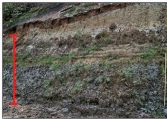
沼の記録を残す露頭(赤線部)

露頭では、下位から礫層、粘土層、細粒砂層、粘土層、完新世層が見られました。沼底で堆積したと判断される地層は粘土層です。その特徴や証