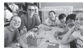
学生訪問団受け入れ時の様子(平成28年度)

【申し込み・問い合わせ】東海村姉妹都市交流協議会事務局(秘書広報課内 ☎282-1711 内線1301)