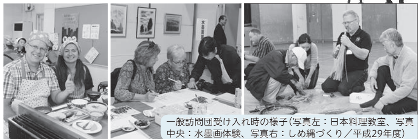
一般訪問団受け入れ時の様子(写真左：日本料理教室、写真中央：水墨画体験、写真右：しめ縄づくり/平成29年度)