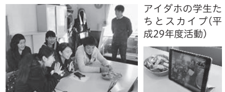
アイダホの学生たちとスカイプ(平成29年度活動)