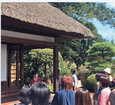
▼東海村の歴史探索ツアー