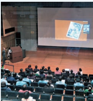
▼女性活躍推進講演会