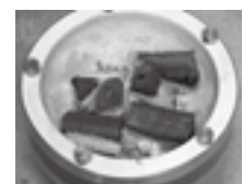
炭などの固体燃料