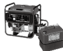
ガソリンなどの発電機用液体燃料