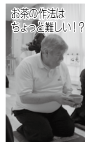
お茶の作法はちょっと難しい？