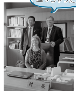
村長の席に座っちゃった！