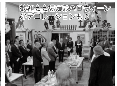
歓迎会会場にはハロウィーンのデコレーションも！