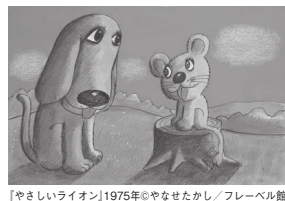
「やさしいライオン」1975年©やなせたかし/フレール館

アンパンマンの作者として、また「手のひらを太陽に」の作詞者として知られる、やなせたかしの全貌を紹介する企画展です。やなせによる絵本や漫画の原画、イラストや墨彩詩画を紹介いたします。