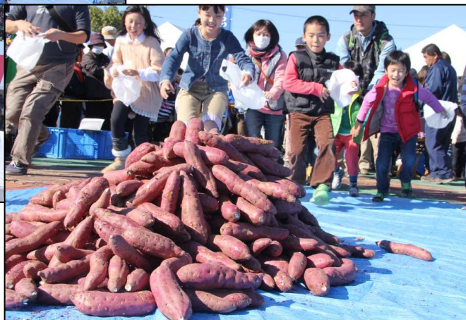
イベント 「ジャンジャンどり」