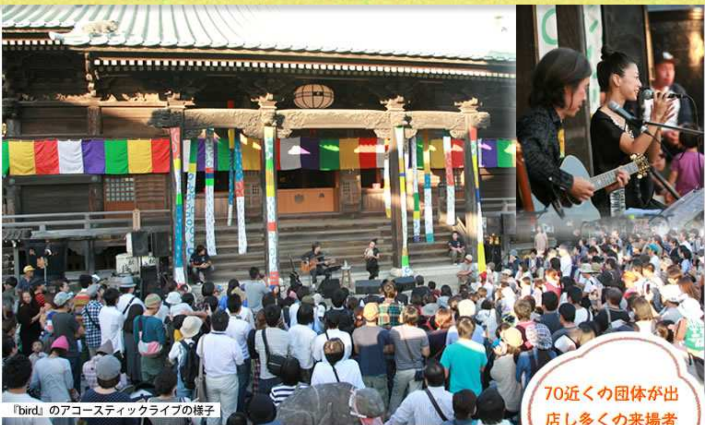
『bird』のアコースティックライブの様子

2013年10月13日に開催された『大空マルシェ』は雲一つない秋晴れのもと開催されました。