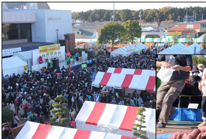
今年の会場の様子 (かなりの賑わいでした)