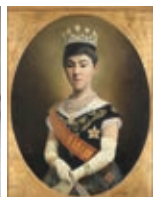
昭憲皇太后肖像 グイド・モリナーリ作(東京都庭園美術館蔵)