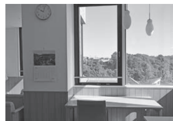
【病室から見える外の風景】

ご家族に会えず、直接顔を合わせることが難しい状況に不安を抱く方もいるかと思います。ご家族が病棟に入れるのは原則、入院時と退院時のみです。そこで、洗濯物や荷物の受け渡しでご家族が来院された際に、看護師から患者さんの様子をお伝えしています。また、タブレットを使用したオンラインでの面会にも対応していますので、詳細は、病棟看護師へお問い合わせください。