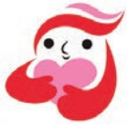
犯罪被害者等支援シンボルマーク ギュっとちゃん