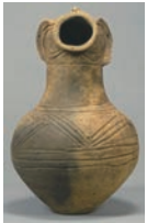
国指定重要文化財「顔面付土器」(明治大学博物館蔵)