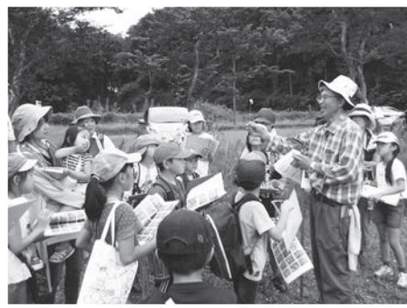
【令和元年度 まる博講座「この草なあに？」より】

村内には、自然に関心を持ち自然観察を続けている多くの方がいるにもかかわらず、これまで、これらの記録を蓄積できる施設がありませんでした。しかし今は交流館が、これらの活動をサポートする拠点を担うと同時に、データセンターとして活用できたらと考えています。