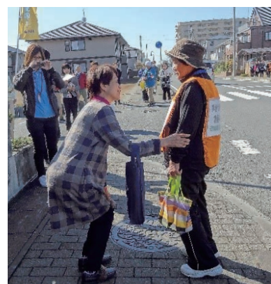
▲各種訓練での活動の様子

民生委員・児童委員は、新型コロナウイルス感染症拡大防止のための「新しい生活様式」に基づき、感染予防対策を徹底しながら、見守りや訪問活動を行っています。