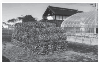
【サツマイモ苗床用落ち葉】

大正10(1921)年茨城県産業調査書を見ると、「植付ノ季節ヲ失スルモノ多キコト」とあります。サツマイモを7月ごろ