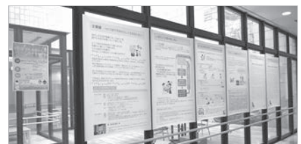
▲昨年村が行ったACPに関する企画展では当院でパネルが展示されました

聞き慣れない方が多いかと思いますが、“人生会議”と聞けば耳にしたことがあるという方もいるのではないのでしょうか。これは、ご自身が望む医療・ケアに関する意向について前もって家族やかかりつけ病院の医師や看護師、自宅に来てくれているヘルパーなどの医療・介護の専門職の方、友人等と話し合いを続けていくことで、意思決定の実現を支援するプロセスを指します。