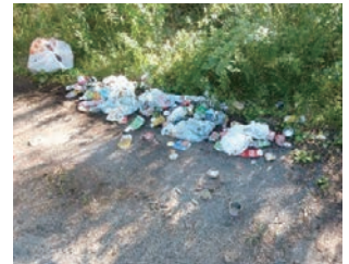
▲不法投棄の現場(村内)

「不法投棄」とは、「 廃棄物処理法 」で定められた処分場以外に廃棄物を投棄することです。不法投棄には厳しい罰則が設けられており、逮捕や罰金の対象となることがあります。ごみを捨てる際は、決まりに従って正しく処分するようにしましょう。