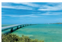
【伊良部大橋(宮古島市)】

10月25日から国内線運航ダイヤが改正され、神戸便・札幌便が1日2往復、福岡便・那覇便が1日1往復するほか、新たに沖縄県の宮古(下地島)への乗継便が設定されました。