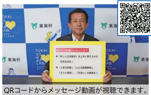
QRコードからメッセージ動画が視聴できます。

公共施設につきましては、6月1日から一部サービスの利用を再開します。なお、村立図書館については、国の対処方針等を踏まえ、5月28日から先行して一部サービスの利用を再開します。村民の皆さんにとって、公共施設の利用は社会生活に欠かせないものであると思いますが、感染防止対策の実効性等を勘案しながら、利用範囲を順次拡大したいと考えていますので、当面のところは、部分開