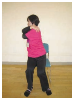
体をゆっくり左右へひねる。