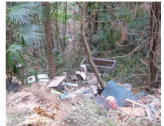
▲不法投棄の現場(村内)

「不法投棄」とは、「 廃棄物処理法 」で定められた処分場以外に廃棄物を投棄することです。不法投棄には厳しい罰則が設けられており、逮捕や罰金の対象となることがあります。ごみを捨てる際は、決まりに従って正しく処分するようにしましょう。