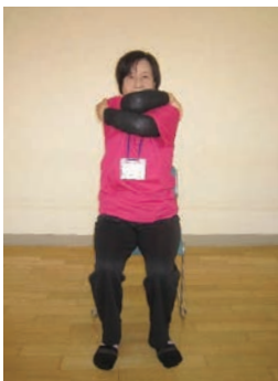
両肩を抱くようにして、肩甲骨の間を伸ばす。