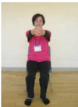
両手を組んで背筋を伸ばす。