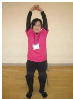
両腕を頭上に上げ、十分に伸ばす。