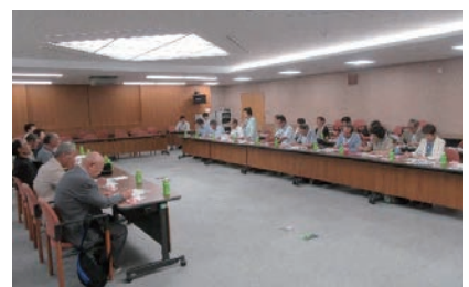
他県の民生委員との研修交流会