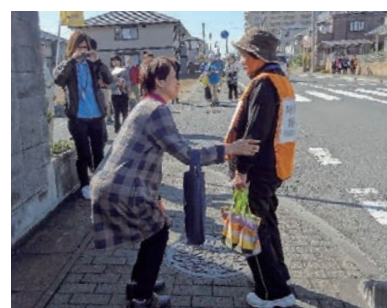
▲各種訓練での活動の様子

民生委員・児童委員の代表的な活動として、村が行う「高齢者状況調査」への協力があります。これは、支援を必要とする方と福祉サービスを結び付け、日常生活の向上を図るほか、災害時における迅速な避難支援のために役立てることを目的とした調査で、民生委員・児童委員が70歳以上の全ての高齢者宅を訪問し、生活状況や健康状態などの把握に努めています。