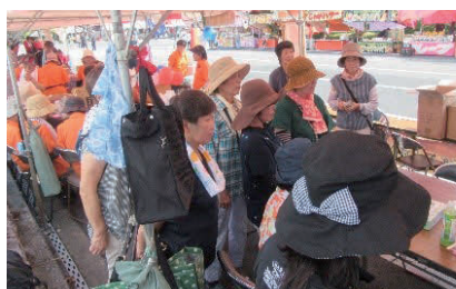
東海まつりでの啓発活動