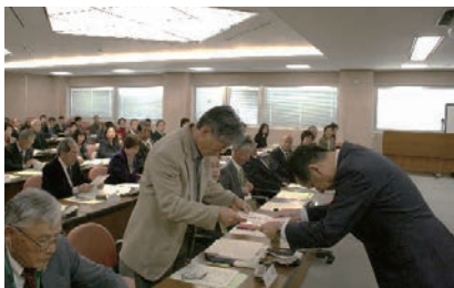
一斉改選に伴う委嘱状伝達式