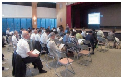
先進地の視察研修